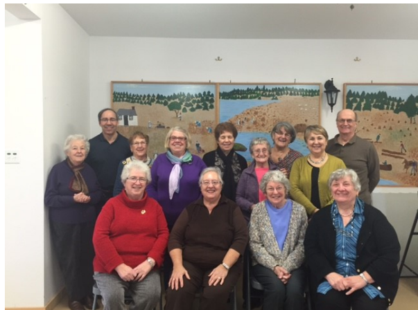
Club d'aînés de Chezzetcook