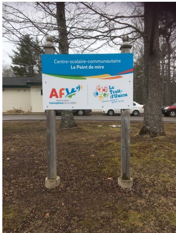
Nouveau panneau d'affichage à l'AFV

Comme toujours, les services en français sont déterminants pour notre association. L'AFV se fait un devoir de faire la promotion de ceux-ci auprès de la communauté de la Vallée.