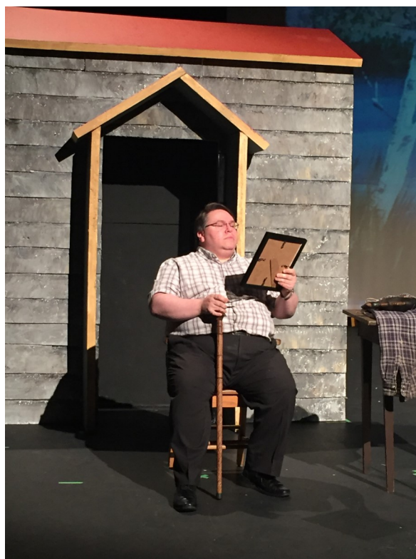
Pièce de théâtre communautaire « Dans son p'tit coin »

Le CAPEB collabore avec plusieurs associations provinciales et régionales afin d'avancer les dossiers pertinents à notre communauté acadienne. Il a connu une année très active au niveau de ses activités et de ses projets grâce aux nombreux bailleurs de fonds, partenariats et bénévoles. Il les remercie.