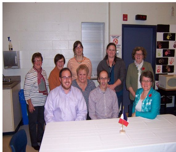
Conseil d'administration de la Société acadienne Sainte-Croix

Enfin, notre Assemblée générale annuelle, tenue au début du mois de novembre, fut un grand succès avec une présence de 40 membres. Le Conseil d'administration de la Société acadienne Sainte-Croix se réunit de façon régulière et trois membres du Conseil d'administration ont voyagé à Halifax afin de représenter la région à l'Assemblée générale annuelle de la Fédération acadienne de la Nouvelle-Écosse.