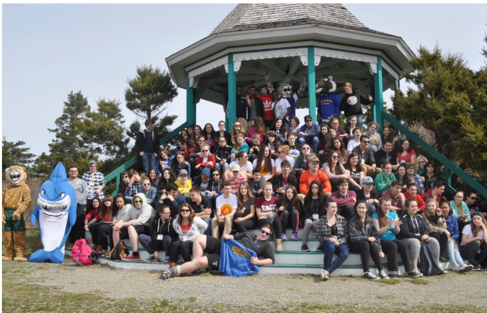
Les jeunes posés au «gazebo» sur les terrains de l'Université Sainte-Anne pendant leur séjour à Autour du FEU, grou rassemblement jeunesse .

Le Conseil scolaire acadien provincial est très fier de sa croissance et de ses réalisations au fil des ans. Nos partenariats et ententes avec les divers organismes locaux, régionaux et provinciaux permettent de concerter nos efforts pour assurer la vitalité et la pérennité de notre langue et culture.